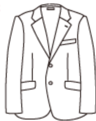
1型ブレザー 左前合わせ